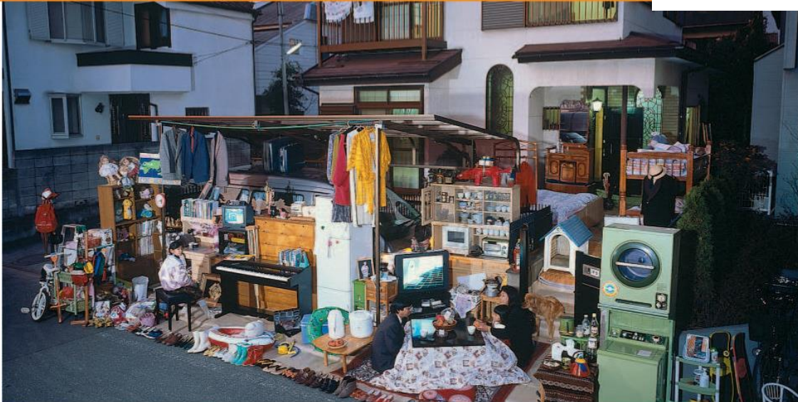
M3 Hausstand der Familie Ukita aus Tokio in Japan (2013: HDI-Wert 0,890 Rang 17, vgl. S. 152/153)